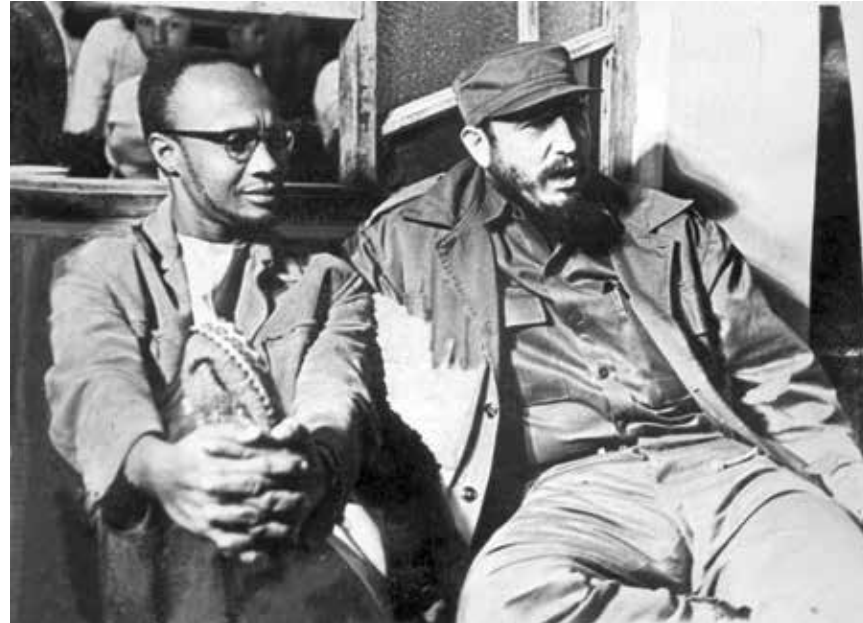
(1966). "Amílcar Cabral com Fidel Castro"

Foi no Alentejo, mais especificamente na zona de Cuba, que, em início dos anos 50, Amílcar Cabral realizou a sua monografia de fim de curso, dedicada à problemática da erosão do solo naquela zona. Já Engenheiro Agrónomo, partiria depois para a Guiné, ao serviço do Estado colonial, mais tarde comprometendo-se com a luta contra o Império Português, mobilizando apoios internacionais muito variados, entre eles destacando-se, a partir de meados dos anos 60, o de Cuba. Este apoio assumiu uma componente militar, mas também formação cultural, nomeadamente no domínio do cinema. Nesta comunicação, onde serão exibidos documentos, fotografias e filmes de arquivo, propõe-se uma viagem transnacional pela segunda metade do século XX.